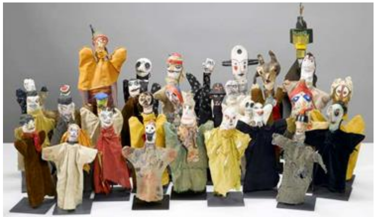
BONECOS DE MARIONETE DE PAUL KLEE

OS BONECOS CRIADOS POR PAUL KLEE SÃO CHAMADOS DE MARIONETES; ALÉM DESTES, EXISTE OS FANTOCHE DE MÃO, QUE PODEM SER CRIADOS A PARTIR DE UMA MEIA.