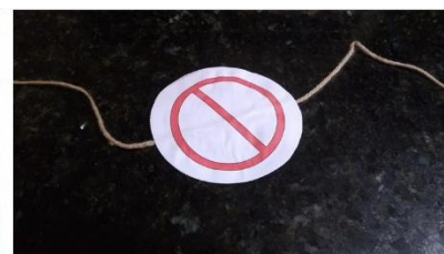
Passo 6 - TAUMATRÓPIO PRONTO

ASSIM QUE SECAR SEU TAUMATRÓPIO ESTARÁ PRONTO.