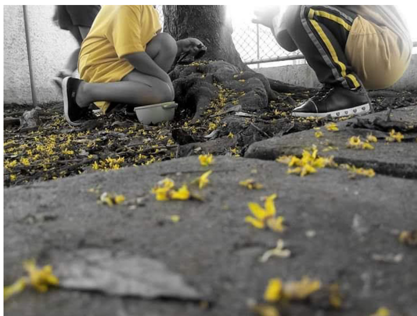
EM Wenceslau Braz

Não cabem ações artificializadas, mecanizadas e aligeiradas desprovidas de sentido, comprometendo a qualidade das relações e dos processos de aprendizagem. Os bebês e as crianças estão sempre aprendendo e inúmeras vezes, muito mais a partir daquilo que não é dito, de nossas ações, do que da nossa fala. Somos referências para elas, assim como também temos muito a aprender com os bebês e as crianças nessa relação de reciprocidade. Cabe aqui a reflexão de que, apesar de toda a tecnologia, recursos e avanços da sociedade, ainda temos muito a aprender no que se refere a cuidar uns dos outros e da natureza.