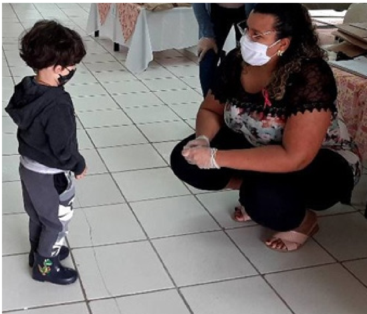
CMEI Centro Cívico