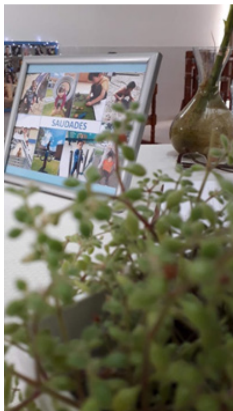
CMEI Lala Schneider

posso acolher há muitas maneiras de se importar, basta buscar que iremos encontrar novas formas de pensar o bem-estar. (Equipe de escrita)