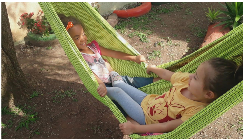
CMEI Moradias Belém

ceu. Cada tempo com suas histórias, recordações de momentos de alegria, choro, conquistas que nos levam a pessoas importantes que fizeram parte de nossos aprendizados e motivaram nossas escolhas. Sem dúvida, muitos pensamentos são de momentos de cuidado, em que o amor, a amizade e o companheirismo foram essenciais.