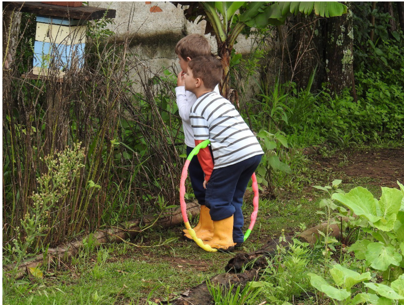
CEI Doutor Leocádio José Correa

Tendo em vista que nossas crianças vivem boa parte de suas infâncias dentro de nossas instituições de Educação Infantil, é essencial nosso olhar e entendimento que esse momento de vida delas seja preenchido com a essência do cuidado, e que esse acontece em nossas ações do cotidiano, o lugar em que vivemos o cuidado, aprendemos a cuidar e ser cuidado.