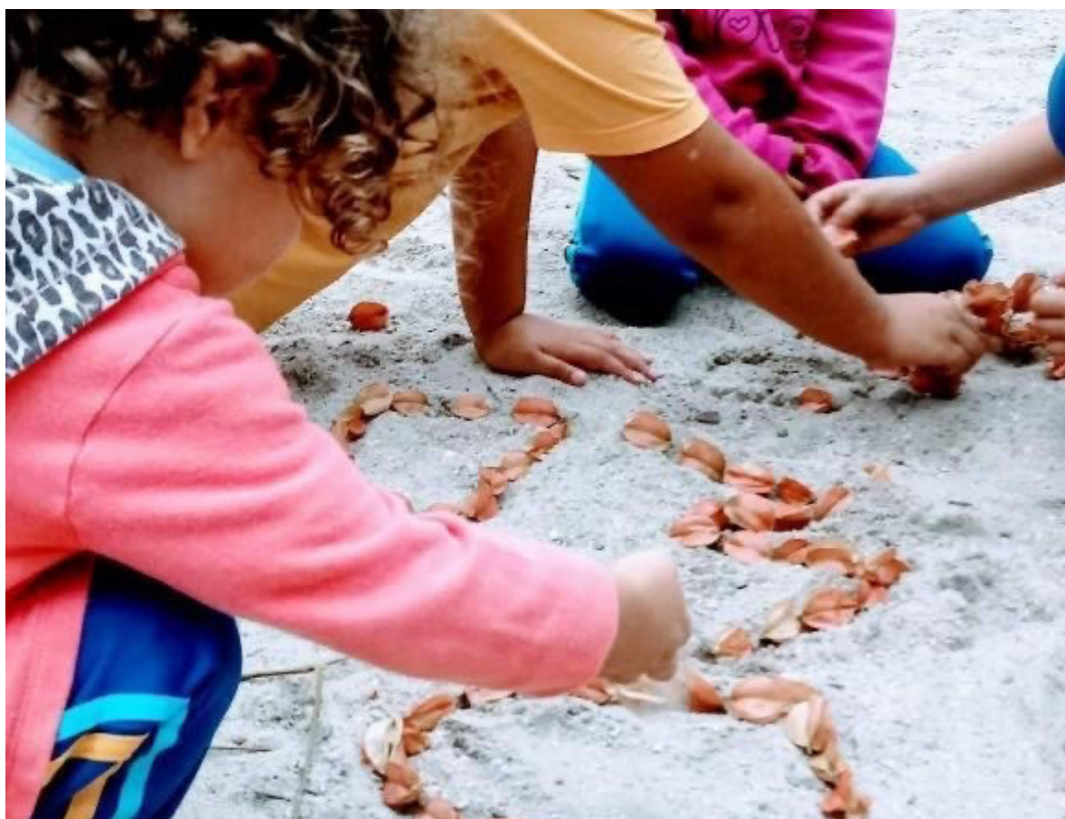
EM Wenceslau Braz

Desejamos bom trabalho a todos e a todas! Equipe do Departamento de Educação Infantil