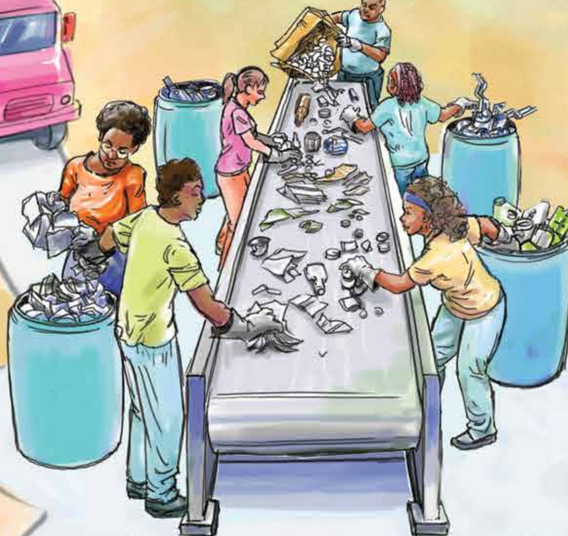
Caminhão de rejeito

Os catadores separam os resíduos que são recicláveis