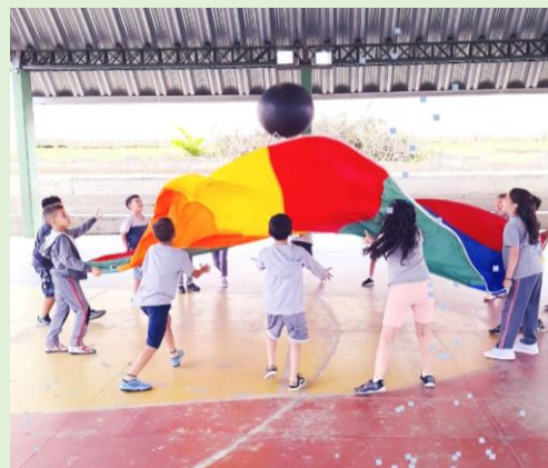
Figura 4: Escola Municipal Maestro Bento Mossurunga