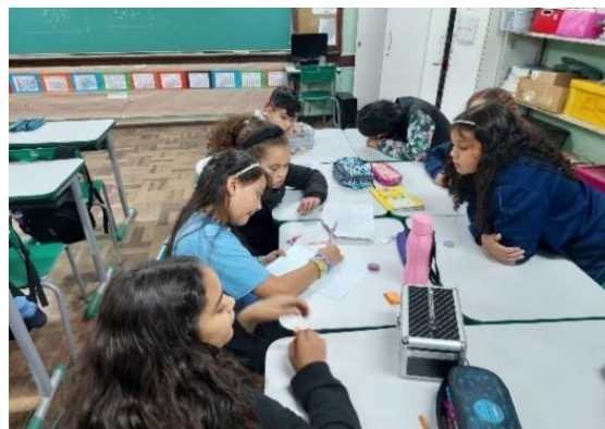
Figura 7: Construção coletiva da tabela do campeonato de automobilismo