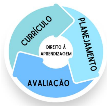
Figura 1: Organização do trabalho pedagógico na RME de Curitiba