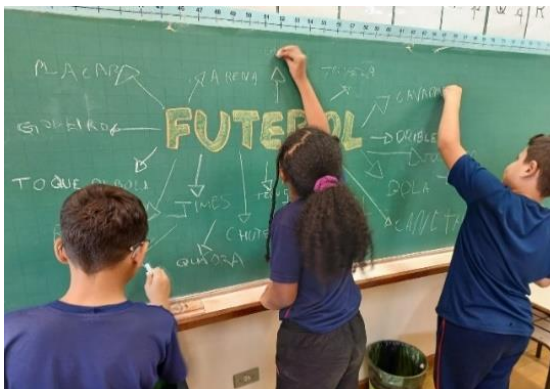
Figura 6: Construção coletiva de mapa conceitual sobre futebol