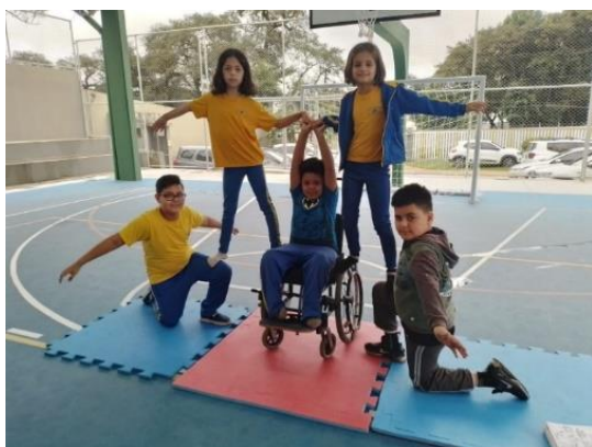
Figura 3: Escola Municipal Professora Carmen Salomão Teixeira

Segundo Villas Boas (2012, p. 38), “Eles são, portanto, participantes ativos da avaliação, selecionando as melhores amostras de seu trabalho para incluí-las no portfólio.” Easley e Mitchel ainda acrescentam, “Além disso, a reflexão sobre o seu trabalho e sobre os critérios permite aos alunos formar novos objetivos de aprendizagem. Assim é que os portfólios