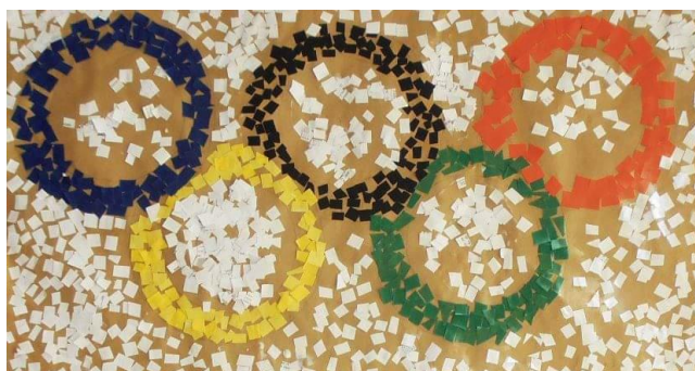
Registro de colagem – aros olímpicos