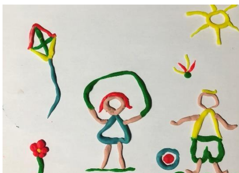
Registro de modelagem