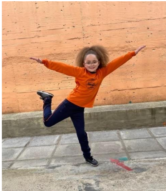
Figura 2: Escola Municipal Miguel Krug

A Educação Física escolar é constituída por uma multiplicidade de saberes que caracterizam sua especificidade, abrangendo práticas corporais diversificadas, multifacetadas e diretamente vinculadas ao corpo, à cultura e ao movimento (Curitiba, Prefeitura Municipal, v. 4. 2020). Enquanto componente curricular pertencente à área das linguagens, compreende a utilização da expressão corporal para contextualizar, problematizar, disseminar e construir conhecimentos sobre o corpo e suas expressões.